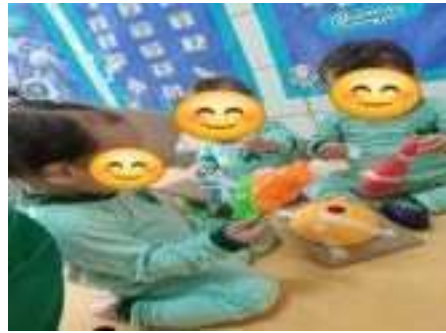
Semana do Brincar