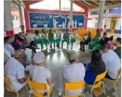
Treinamento Compliance (Colaboradores)