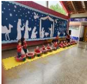
Cantata de Natal