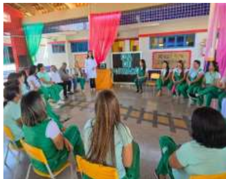
3º Dia de formação da Educação Infantil