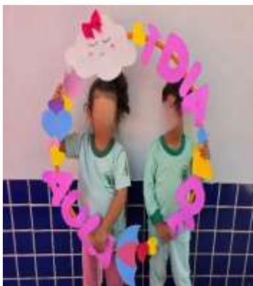
Semana de Inserção e Acolhimento

No mês de fevereiro (10/02 a 28/02) o trabalho foi pautado nos Campos de experiência: Escuta, fala, pensamento e imaginação; Traços, sons, cores e formas; O eu, o outro e nós e Espaços, tempos, quantidades relações e transformações e nos documentos norteadores da SEEDF, Currículo em Movimento e BNCC. O mês foi pautado nos projetos: Inserção e acolhimento e Cooperação e liderança, com atividades de: Recepção divertida com fantasias, teatro, atividades artísticas coletivas, oficina de brinquedos sensoriais, visite aos ambientes da creche, roda de leitura e contações de histórias, musicalização, brincadeiras de faz de conta, brincadeira chuvinha de papel, caça ao tesouro, atividades de psicomotricidade, construção dos combinados e da chamadinha da turma, visitação e cuidado da horta, grafismo, pintura de rosto, bailinho de carnaval, ajudante do dia, festas dos aniversariantes.