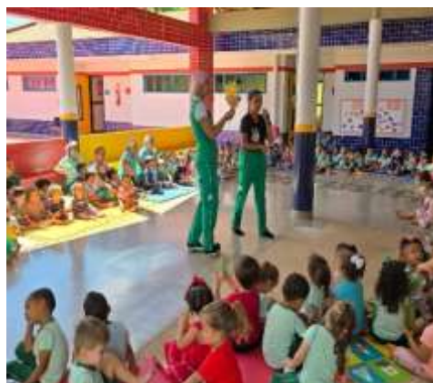
Roda de conversa coletiva