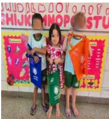
Projeto Leitor em formação

No mês de março (03/03 a 28/03) o trabalho foi pautado nos Campos de experiência: Escuta, fala, pensamento e imaginação; Traços, sons, cores e formas; O eu, o outro e nós e Espaços, tempos, quantidades relações e transformações e nos documentos norteadores da SEEDF, Currículo em Movimento e BNCC. O mês foi pautado nos projetos: Janela do saber - Leitor em formação; Semana Distrital de Conscientização e Promoção da Educação Inclusiva aos Alunos com Necessidades Educacionais Especiais (Lei Distrital nº 6.849/2021); Semana da Conscientização do Uso Sustentável da Água nas UE/SEEDF (Lei Distrital nº 5.243/2013); Alimentação saudável; Semana Escolar de Combate à Violência contra a Mulher – (Lei Federal nº 14.164/2021); Permita-se sentir; Acolhimento, atividades ao ar livre, como: pique pega, corrida, piquenique literário, tenda da leitura, atividades de psicomotricidade, Roda de conversa, dinâmica sensorial dos sentidos, caixa surpresa, roda de conversa sobre o respeito, atividades sobre a economia de água, experimentos.