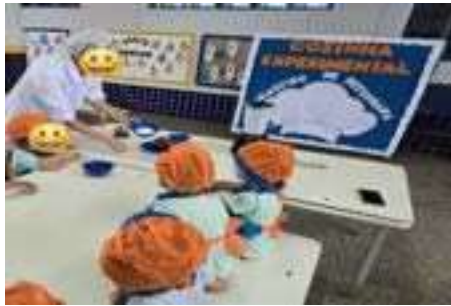
Cozinha experimental: Brigadeiro de beterraba