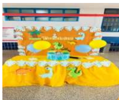
Aniversariantes do mês