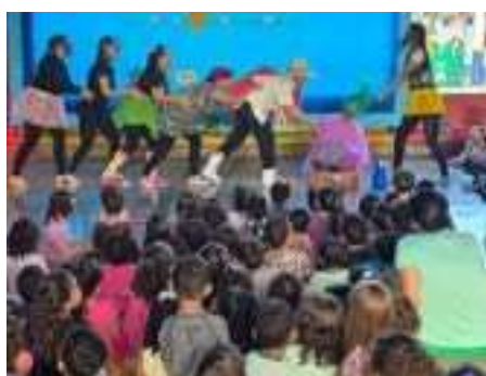
Atividade pedagógica: História cantada.