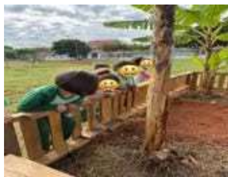
Início do projeto ecologia