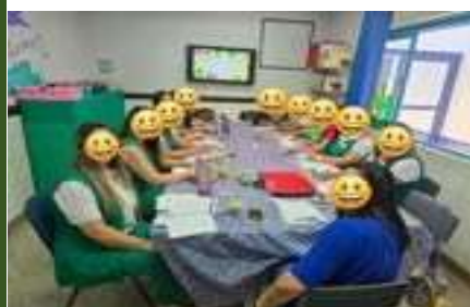
Reuniao de Diretora e Coord.