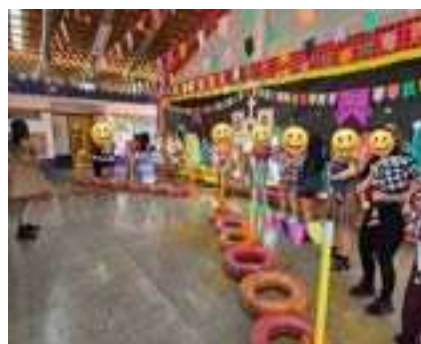
Festa Junina (13/06)