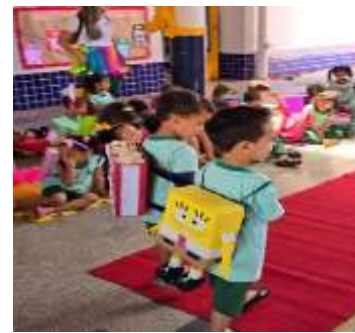
Semana da criança