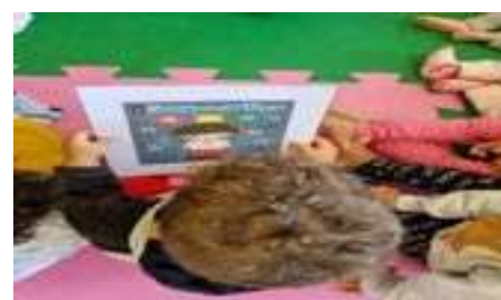
Mai Laranja: Mês combate abuso De crianças e adolescentes