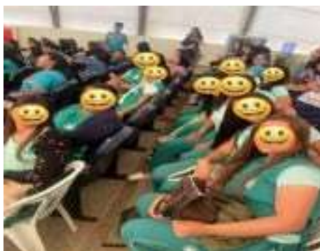
Dia de Formação continuada dos profissionais da educação (09/06)