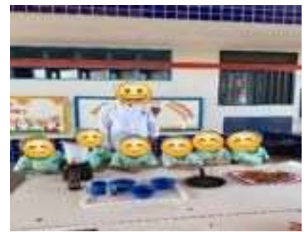
Cozinha experimental: Doritos saudável de arroz.