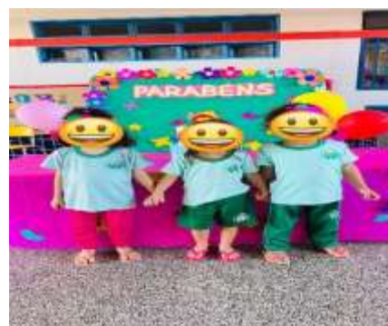
Aniversariantes do Mês