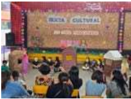
Apresentação: Sexta Cultural