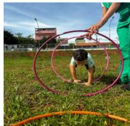
Atividade de psicomotricidade