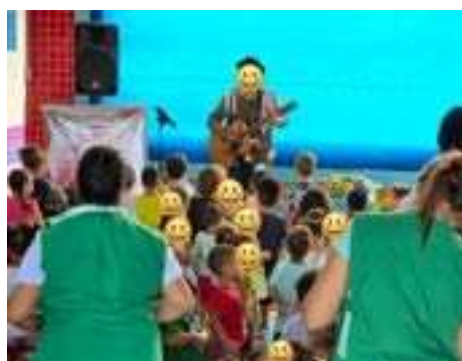
Apreciação da Caravana de histórias.