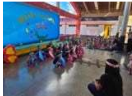
Apresentação: Sexta Cultural