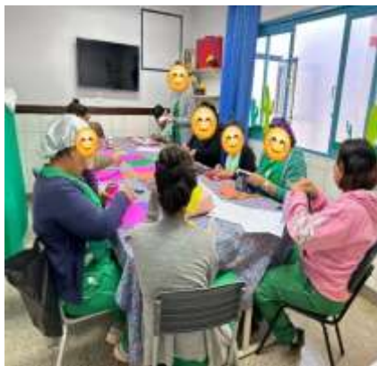
Coordenação Pedagógica Equipe de Monitoras