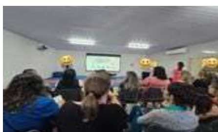
2º Forum Coord. Educ. Infantil 13/05