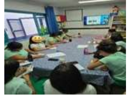
Dia de Formação continuada para os profissionais da educação 09/04