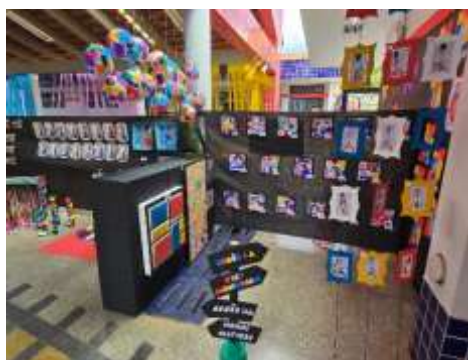
Mostra de Arte Literaria