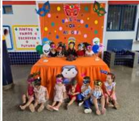
Aniversariantes do Mês