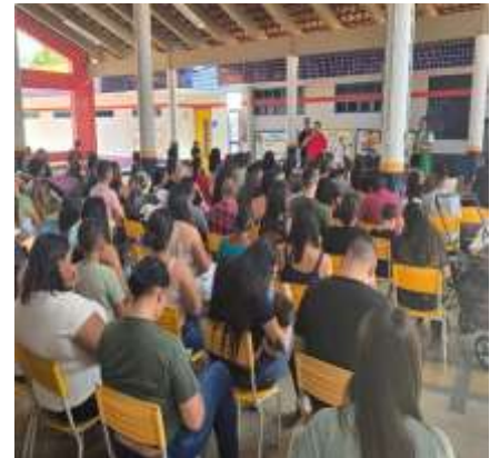
Primeira reunião de Pais 2025