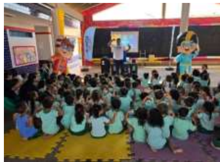
Adasa na Escola