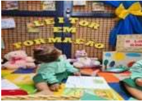
Abertura do projeto: Leitor em Formação