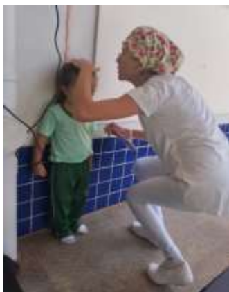
Pesagem das crianças