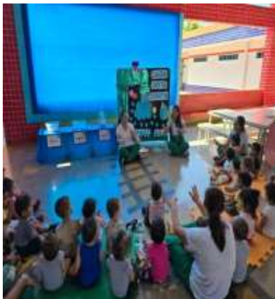
Semana de Conscientização do Uso da água