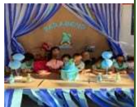
Aniversariantes do mês de maio