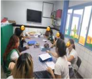
Conselho de Classe 2º Semestre

No mês de dezembro (1º ao dia 19/12) o trabalho foi pautado nos Campos de experiência: Escuta, fala, pensamento e imaginação; Traços, sons, cores e formas; O eu, o outro e nós e Espaços, tempos, quantidades, relações e transformações e nos documentos norteadores da SEEDF, Currículo em Movimento e BNCC. O mês foi pautado nos projetos: Escola e família; o brincar como direito dos bebês e das crianças e Transição escolar e as seguintes atividades: Brincadeiras dirigidas ao ar livre; Pintura de rosto; História coletiva: cada criança contribui com uma parte da narrativa até formar uma história completa; Votação para a escolha de brincadeiras que serão realizadas na última semana de aula: Proporcionar opções para escolherem (dança da cadeira, passa anel, pega-pega, brincadeiras com caixa dos brinquedos, entre outros); Brincadeiras ao ar livre; Contações de histórias e passeio nas imediações da instituição.