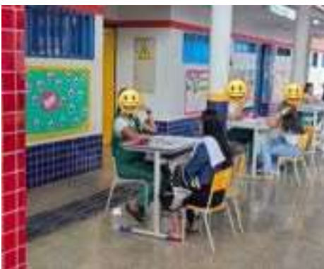
Reunião Mensal – Pais e Professores