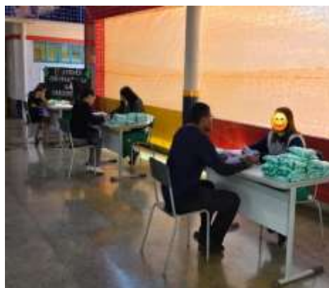
1ª Reunião Semestral/Entrega RDIC