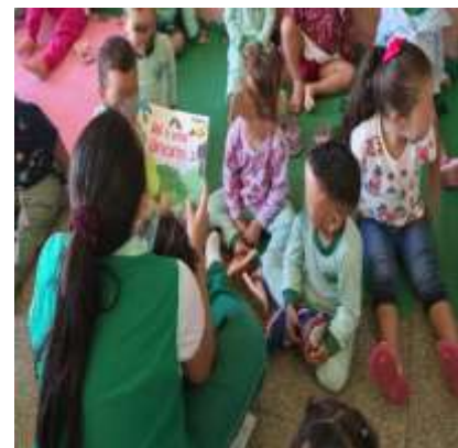
Semana de Inserção e Acolhimento