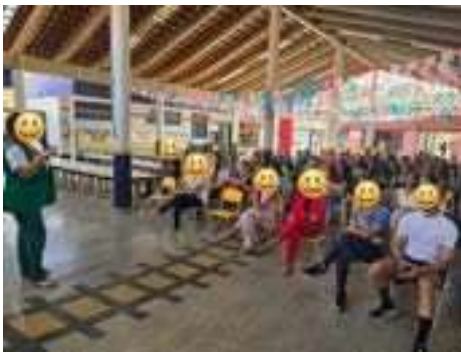
Reunião mensal de pais e professores.