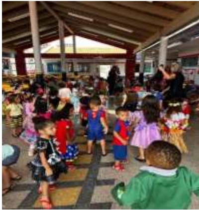
Bailinho de carnaval