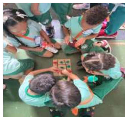
Visitação das Crianças na Plenarinha