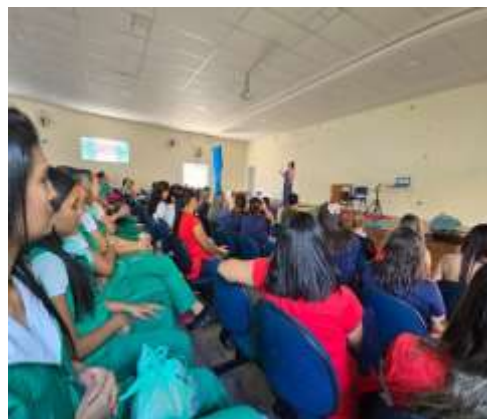
Formação com as Professoras