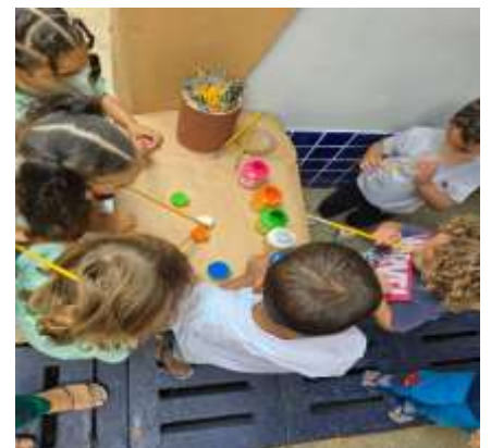
Semana de Conscientização da Educação Inclusiva