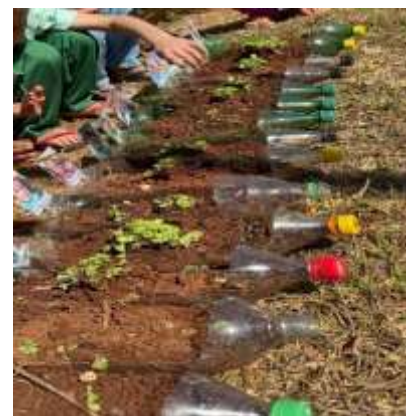
Cuidando da Horta