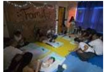
Festa da Família