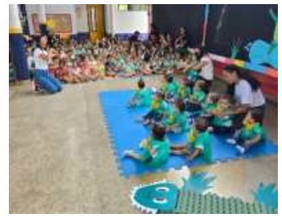
Apresentação Sexta Cultural