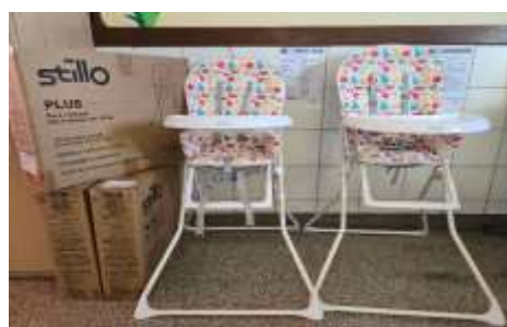
Novos Caderões Berçário I