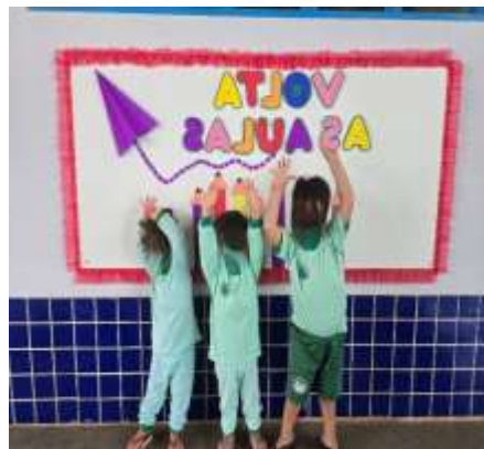
Semana de Inserção e Acolhimento