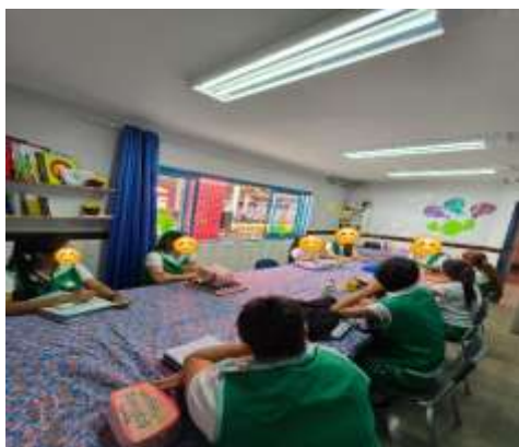
Coordenação Pedagógica Equipe de Professoras

No mês de julho (1º ao dia 10 e do dia 28 ao dia 31/07) o trabalho foi pautado nos Campos de experiência: Escuta, fala, pensamento e imaginação; Traços, sons, cores e formas; O eu, o outro e nós e Espaços, tempos, quantidades, relações e transformações e nos documentos norteadores da SEEDF, Currículo em Movimento e BNCC. O mês foi pautado nos projetos: Semana do brincar e Inserção e acolhimento, com atividades de: conhecer a história de diferentes esportes; aprender a jogar vários esportes, como: futebol, vôlei, queimada, etc; brincadeira com peteca; acolhida divertida; Semáforo da saudação; promover momentos de diálogo para que as crianças possam compartilhar suas experiências das férias; contação de História com fantoches, socializar com outras turmas; caixa surpresa; passeio pela área verde da instituição; brincadeiras ao ar livre. Do dia 11 ao dia 27 período de férias segundo o calendário escolar 2025 da IEP, portaria ° 1.562.