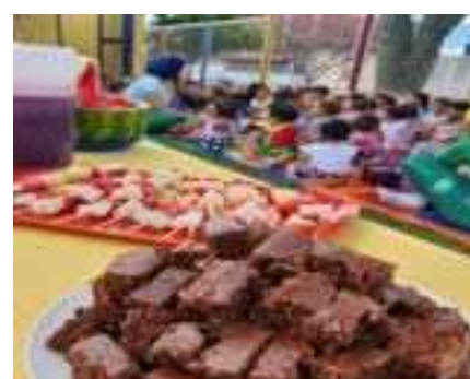
Piquenique dos vencedores do Desperdício zero.