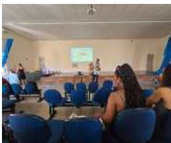
3º Fórum de coordenadores