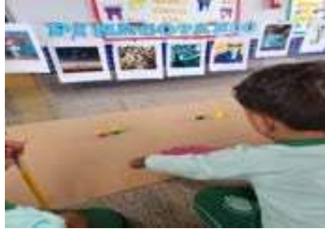
Abertura do projeto: Pinacontando